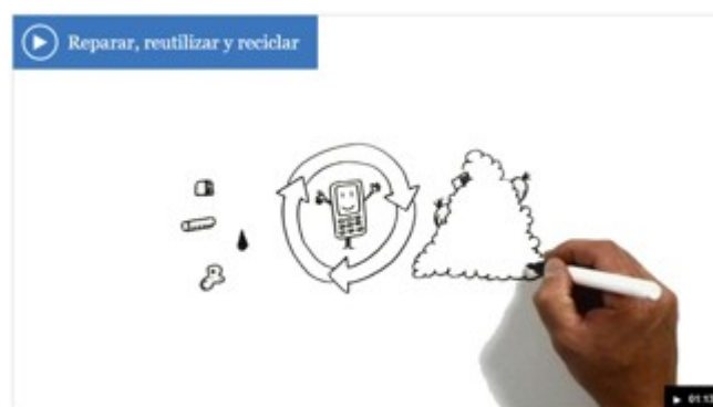
Imagen del video Reparar, reciclar y reutilizar del Parlamento Europeo

En el siguiente video del Parlamento Europeo podemos ver en qué consiste: